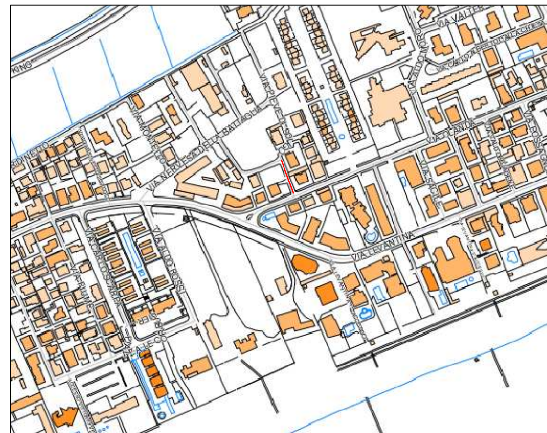
ESTRATTO DI C.T.R.

Il Comune di Jesolo ha un Sistema Qualità certificato in accordo alla norma UNI EN ISO 9002 per i seguenti uffici: Commercio, Tributi, Pianificazione e Attività Edilizia